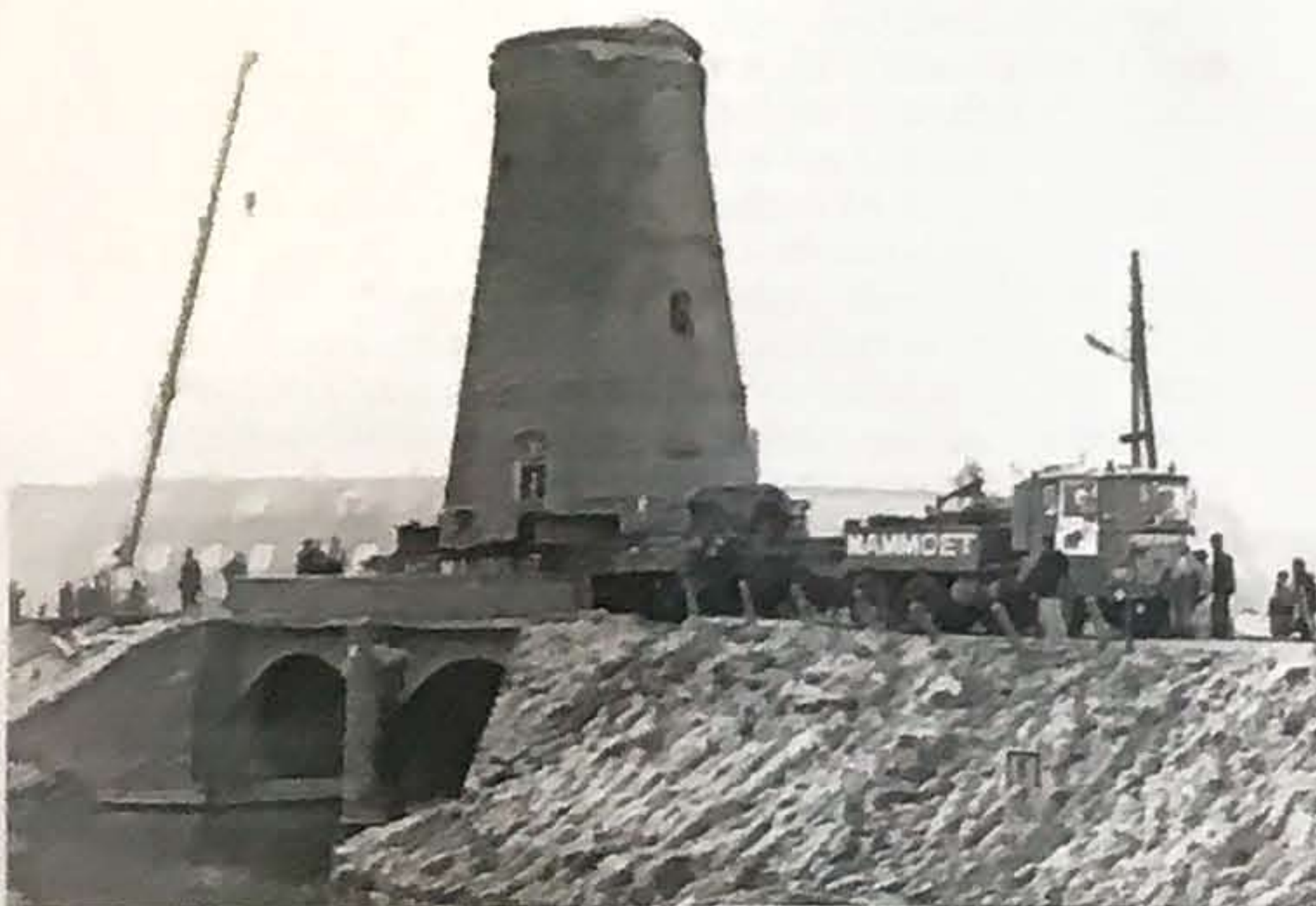
Transport van molen De Eersteling in 1977.