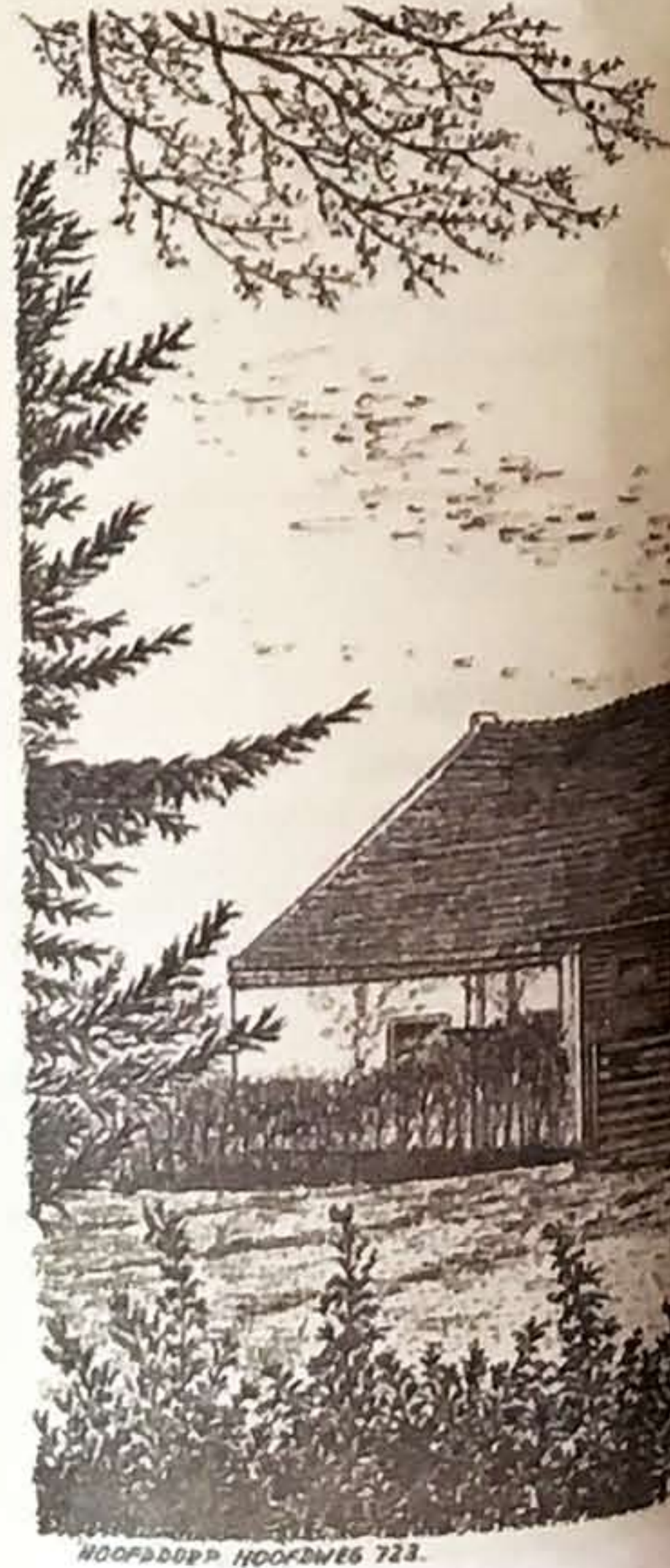
HOOFDDORP HOOFDVAART 722.

Deelnemers aan de wandeling verzamelen woensdag 31 mei om 19.45 uur bij de ingang van zorgcentrum Horizon. Na een kopje koffie begint de rondleiding van anderhalf uur. Daarna kan in de Horizon ook nog worden nagepraat. Opgeven kan via activiteiten@hetoudebuurtje.nl of via de intekenlijst bij de receptie van de Horizon. Deelname is gratis.